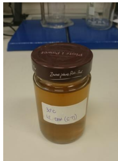
Slika 5. Čaj od lista masline u staklenci