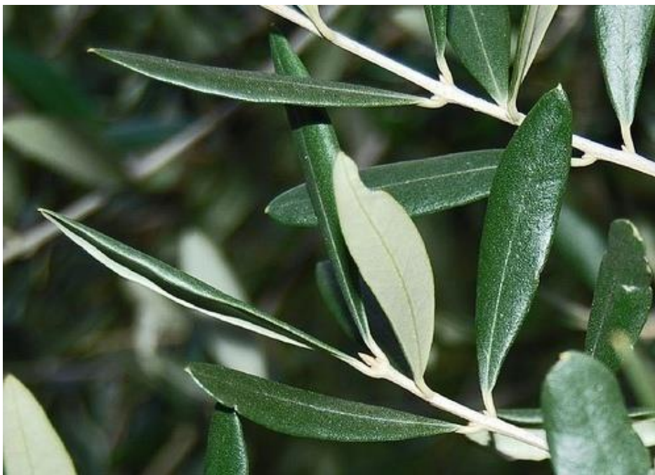
Slika 1. Lišće masline (Anonymous, 2016.)

Listovi masline su mali, duguljasti i kožasti. Lice lista je svijetlozelene boje, a naličje je bijelo. Lišće je po granama pravilno razdijeljeno tako da se po dva lista nalaze jedan nasuprot drugom, a grana završava s jednim listom. U pazušcima listova smješteni su pupovi, koji su šiljasti ili okrugli. Šiljasti su pupovi drveni, a okrugli su cvjetni (Kantonci, 2006.).