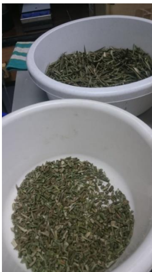
Slika 4. Osušeno lišće masline

Ukupni fenoli i antioksidacijski kapacitet određivali su se nakon što su skupljeni svi uzorci, pa su se za 0., 1., 21., 42. i 63. dana skladištenja, napitci smrzavali i čuvali na -80 °C do analize.