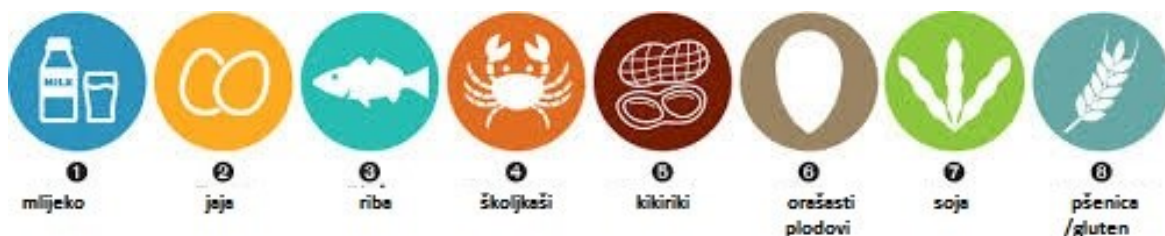
Slika 1. “Big 8”- osam najpoznatijih i najčešćih alergena u svijetu

Alergeni su tvari koje izazivaju alergijsku reakciju i teško ih je pri uobičajenom načinu života izbjeći. Oni su svuda oko nas, u hrani, lijekovima, sredstvima za pranje, odjeći, nakitu, prirodi i okolini u kojoj živimo. U hrani je najčešće riječ o proteinima kao izazivačima alergijskih reakcija (Colić- Barić, 2009).