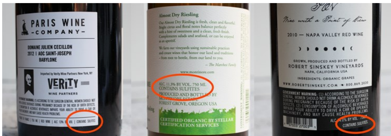
Slika 3. Označavanje sulfita na etiketi ( http://www.thekitchn.com/the-truth-about-sulfites-in-wine-myths-of-red-wine-headaches-100878 )

Primjer takvog upozorenja na ambalaži prikazan je na slici 3.