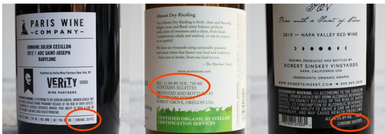
Slika 3. Označavanje sulfita na etiketi

Primjer takvog upozorenja na ambalaži prikazan je na slici 3.