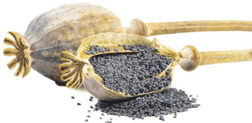
Slika 1. Čahura i sjeme maka (Anonymous, 2016).

Smatra se da je mak samooplodna biljka, ali prema nekim studijama može doći i do oplodnje putem insekata (Singh i sur., 1999). Međutim, planirani uzgoj opijumskog maka započeo je nedavno i koriste se različite metode selekcije i razmnožavanja kako bi se dobile kulture sa visokim prinosom sjemena i kvalitetnim uljem za prehranu (Singh i sur., 1995).