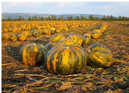
Slika 1. Buča (Anonymous, 2017)

Na slici 1 prikazana je jedna od nekoliko vrsta buča, točnije C.pepo var. styriaca , koje se uzgajaju za proizvodnju ulja iz njihovih sjemenki.