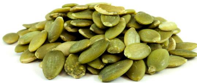
Slika 2. Bučina koštica golica (Alibaba, 2017)

Sjemenka ili koštica je bjelkasta ili žuta, dugačka 7-15 mm (Karlović i Andrić, 1996). Plosnata koštica uljane bundeve je zaštićena ljuskom. Ovisno od strukture i udjela celuloze u ljusci, postoje dvije vrste koštice: s ljuskom i bez ljuske (tzv. golica). Na slici 2 prikazana je bučina koštica koja dozrijeva bez ljuske, tj. golica ili Čermakova beskorka, koja je kao uljana sirovina od naročitog interesa jer joj je udio ulja vrlo visok, a pogača ili sačma nakon izdvajanja ulja ima visok udjel bjelančevina, a malo celuloze (Rac, 1964). Kod koštice golice umjesto čvrste, bijele celulozne ljuske na jezgru prijanja tanka opna tamno-zelene boje (Gajšek, 2016). Takav tip koštice bez bijele ljuske dobiven je selekcijom u drugoj polovici 19. stoljeća u Austriji ( C. pepo var. styriaca ). Oba tipa koštice se koriste za proizvodnju ulja, ali je koštica golica pogodnija jer daje veće iskorištenje procesa i pogaču bolje kvalitete (Škof, 2014).