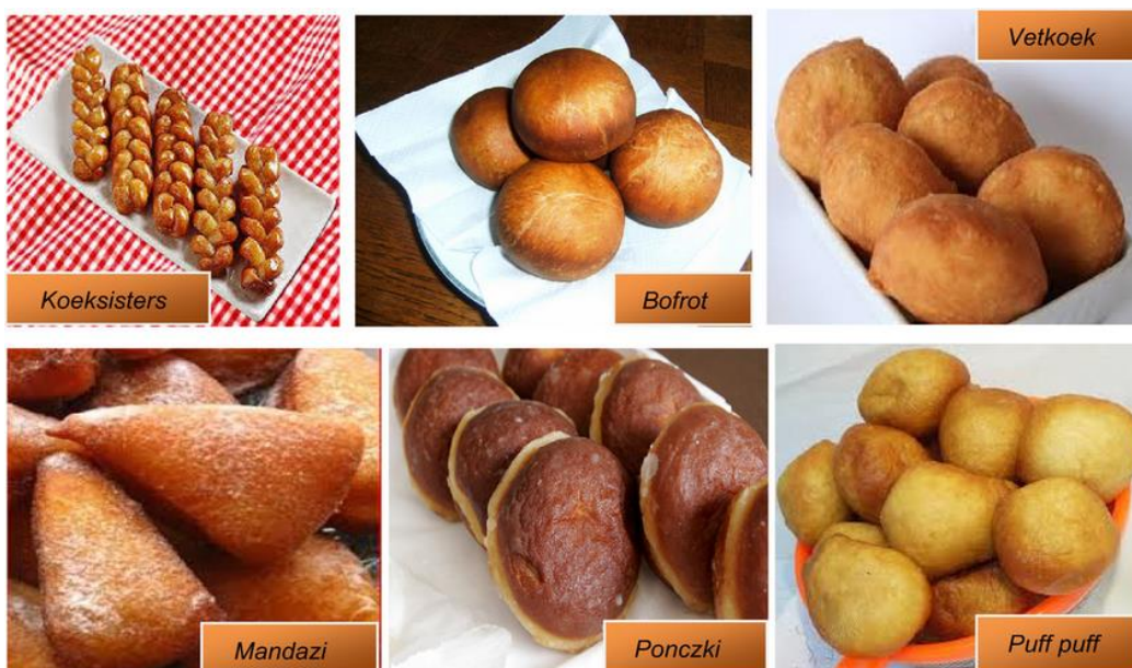
Slika 4. Prženi proizvodi na bazi žitarica sa potencijalom za uključivanje pšeničnih posija (Onipe i sur., 2015)

Uključivanje pšeničnih posija u pržene proizvode od žitarica pokazalo se da smanjuje sadržaj ulja. Pšenične posije se mogu miješati sa pšeničnim brašnom ručno ili hibridizacijskim sistemom objašnjenim ranije. Kim i sur. (2012) su izvjestili o smanjenju udjela ulja od 2,7-9,4% u krafnama pripremljenim od pšeničnih posija čestica veličine 6,87 \mu\text{m} . Yadav i Rajan (2012) izvjestili su da su pšenične posije imale negativan utjecaj na sadržaj vlage u indijskom duboko prženom tijestu, poori (Slika 4), zbog svoje netopljivosti u vodi, ali je ipak došlo do 20%-tnog smanjenja sadržaja ulja kod ugradnje 3% posija. Čini se da je minimalan posao odrađen kod ugradnje pšeničnih posija u tijesta i proizvode za prženje, ali nekoliko radova navedenih ovdje ističe potencijal koji pšenične posije imaju za smanjenje udjela masti/ulja u tim proizvodima. Zbog povezanosti prehrane i zdravlja, posebice kada je u pitanju prekomjerna težina/pretilost, potrebno je više pažnje usmjeriti na proizvodnju pržene hrane sa pšeničnim posijama, smanjenim udjelom masnoće, povećanim udjelom vlakana i optimalnim senzorskim svojstvima.