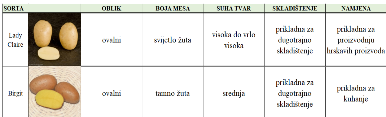
Tablica 3. Karakteristike sorti Lady Claire i Birgit (Anonymous 4, 2017, Anonymous 5, 2017):