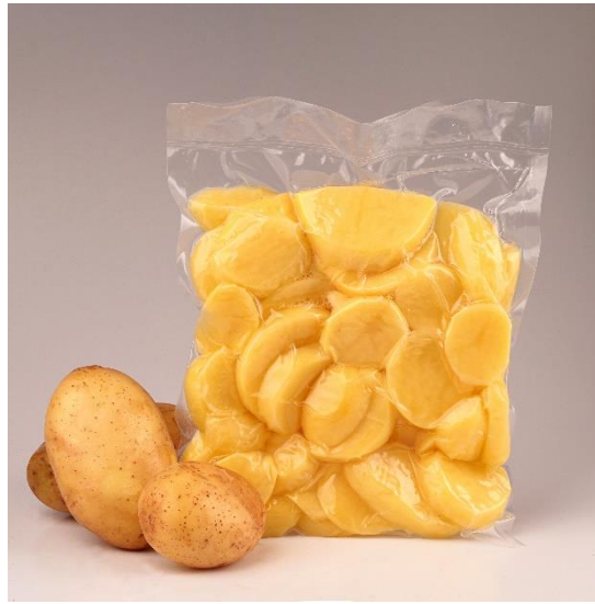
Slika 2. Minimalno procesirani krumpir (Anonymous 3, 2012)

povišene koncentracije CO 2 i/ili niske koncentracije O 2 i nisku razinu respiracije. Krumpiri također moraju zadovoljiti i kriterije kvalitete poput suhe tvari, količine reducirajućih šećera i škroba, morfološke kriterije poput oblika i veličine i organoleptičke kriterije teksture, okusa, mirisa i boje. Gomolji moraju imati pravilan oblik, bez defekata, dobrih organoleptičkih svojstava, nisku sklonost posmeđivanju i moraju biti prikladni za dugotrajno skladištenje (Rocculi i sur., 2009)