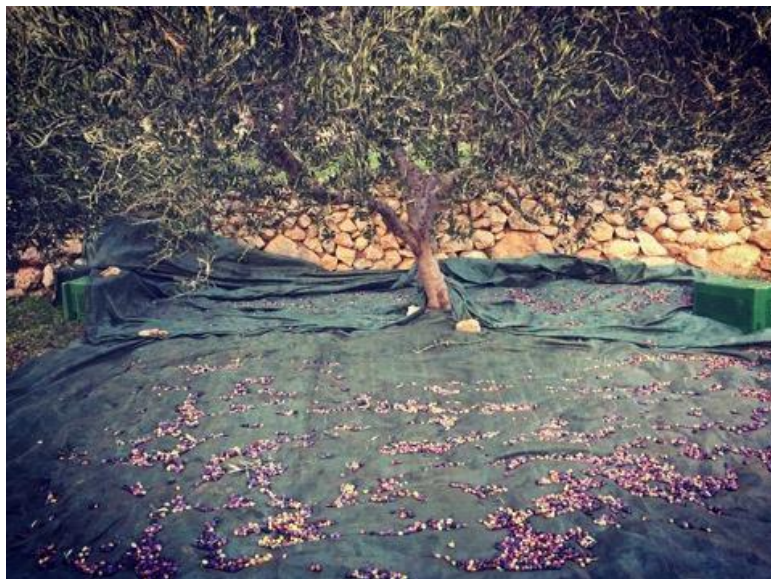
Slika 7. Tradicionalni način berbe na otoku Hvaru

utrošak energije i daje manje iskorištenje. Treći mogući način berbe je sakupljanje plodova sa tla. On se ne preporuča jer može doći do promjena u mesu ploda zbog višednevnog stajanja na tlu i upravo zbog toga je ulje slabije kvalitete (Škarica i sur.,1996).