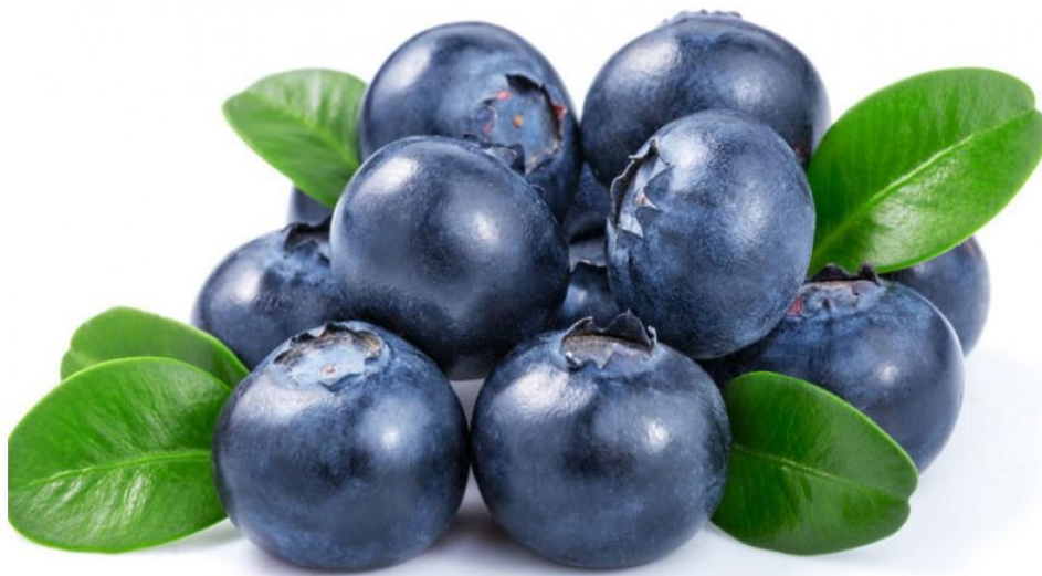
Slika 1. Borovnica (Anonymous, 1)

Borovnica je bobičasto voće koje pripada porodici Ericaceae , rod Vaccinium . Obična borovnica ( Vaccinium myrtillus ) potječe iz sjeverne Amerike i pripada grupi šumskog voća. Raste u crnogoričnim i bjelogoričnim šumama, vrištinama i guštarama planinskog područja. To je nizak, vrlo razgranjen listopadni grm visine 20-50 cm, čvorave stabljike i puzavog korijena, listovi su okruglasto-jajoliki s kratkom peteljkom, a cvjetovi su svijetloružičaste boje. Borovnica ima sočne modrocne bobice, veličine 5-8 mm. Boja je rezultat visoke koncentracije pigmenata (antocijana). Cvate od lipnja do kolovoza, ovisno o visini i položaju staništa (Gursky,1999). Sorte se razlikuju s obzirom na veličinu ploda, broj sjemenki, udio antocijana, kiselost, topljivim i netopljivim komponentama te okusu. Neke od sorti su Duke, Hannah's choice, Elliotte, Bluetta, Bluecrop, Bluereya Cabot, Siera i dr. Količina antocijana u plodovima iznosi od 300 do 698 mg/100g i povećava se u procesu dozrijevanja (Jaakola i sur., 2002).