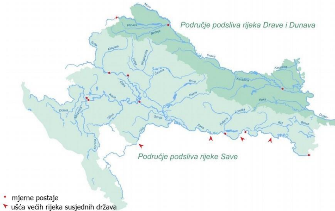
Slika 1: Prikaz lokacije mjernih postaja (karta koja prikazuje područje crnomorskog sliva u Hrvatskoj)