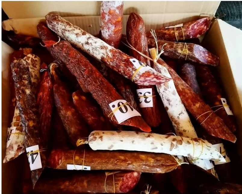
Slika 1. Domaće trajne kobasice s područja Banije

U ovom radu provedeno je određivanje udjela natrijevog klorida u 22 uzorka trajnih kobasica s područja Banije. Kobasice su bile na senzorskoj procjeni u Petrinji, u sklopu 13. Petrinjske kobasijade te su prikazane na Slici 1.