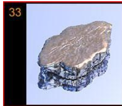
Slika 1. Arsen u elementarnom stanju (Dopuđa, 2008)

Arsen (Slika 1) je kemijski element koji pripada petnaestoj skupini periodnog sustava elemenata, zajedno s dušikom, fosforom, antimonom i bizmutom. Ova skupina elemenata se još naziva dušikova skupina, a u njoj se potpuno mijenjaju osobine elementarnih tvari od izrazito nemetalnih do metalnih. Arsen je polumetal jer ovisno o spoju u kojem se nalazi može pokazivati svojstva metala odnosno nemetala (Filipović i Lipanović, 1995).