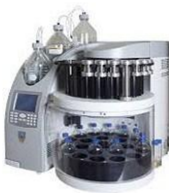
Slika 3. Sustav za ubrzanu ekstrakciju otapalima (Dionex ASE 350) (Thermo Scientific Application Note 1108, 2014)