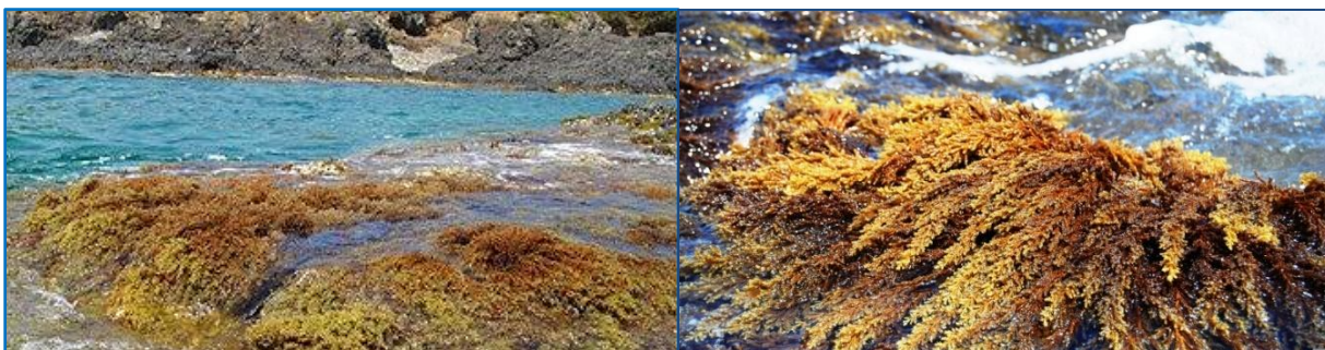
a) b) Slika 1. Smeđa alga Cystoseira : a) (Anonymous 2, 2015), b) (Anonymous 3, 2008)