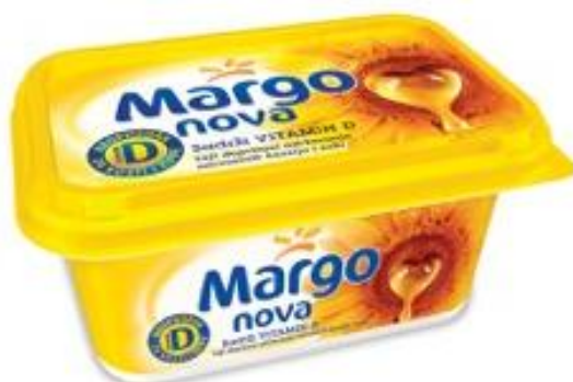
Slika 4. Margo namaz (Zvijezda, 2016)

Tvrtka Zvijezda d. d. proizvodi mazive margarine – Margo nova (slika 4), Margo Jogurt, Margo Light te mazive margarine bogate omega-3 masnom kiselinom – Omegol i Omegol sa sjemenkama lana. Mazivi margarini tvrtke Zvijezda d. d. sadrže vitamine A, D i E (Zvijezda 2016).