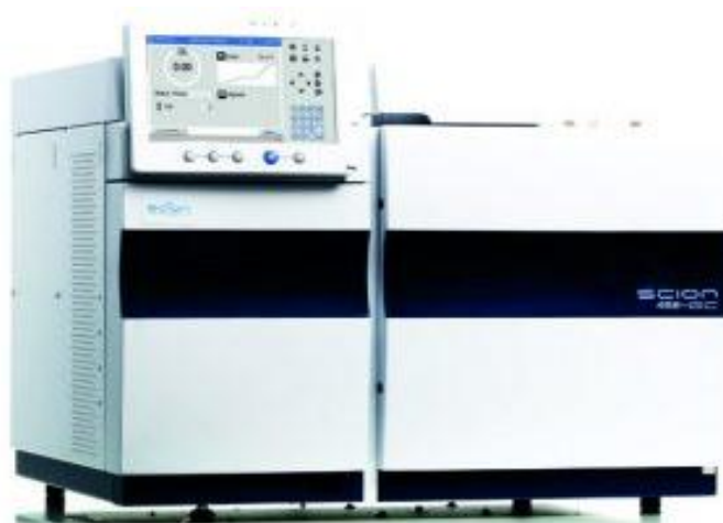
Slika 5. SCION 456-GC (SCION Instruments, 2014)