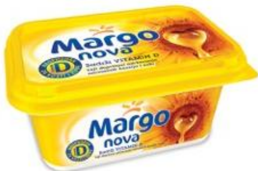
Slika 4. Margo namaz (Zvijezda, 2016)

Tvrtka Zvijezda d. d. proizvodi mazive margarine – Margo nova (slika 4), Margo Jogurt, Margo Light te mazive margarine bogate omega-3 masnom kiselinom – Omegol i Omegol sa sjemenkama lana. Mazivi margarini tvrtke Zvijezda d. d. sadrže vitamine A, D i E (Zvijezda 2016).