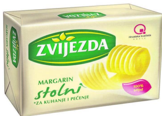
Slika 3. Stolni margarin Zvijezda (Zvijezda, 2016)