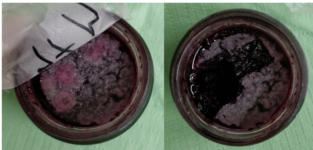
Slika 5. Prikaz pekmeza broj 47 prije (lijevo) i poslije (desno) uzorkovanja (vlastita fotografija)

Priprema uzorka provedena je tako što su od svakog uzorka pekmeza iz staklene teglice uzeta tri poduzorka. Poduzorak M1 označava površinu pekmeza gdje je porasla plijesan, poduzorak M2 označava površinu uzorka pekmeza koji je 1 cm udaljen od mjesta porasle plijesni dok poduzorak M3 označava uzorak pekmeza koji je uzet na dubini 1 cm ispod mjesta porasle plijesni. Uzorci MA, MB i MC označavaju različitu vrstu plijesni poraslih na površini pekmeza iste teglice pekmeza i ekvivalent su poduzorku M1. Slika 5 prikazuje primjer uzorkovanja pekmeza.