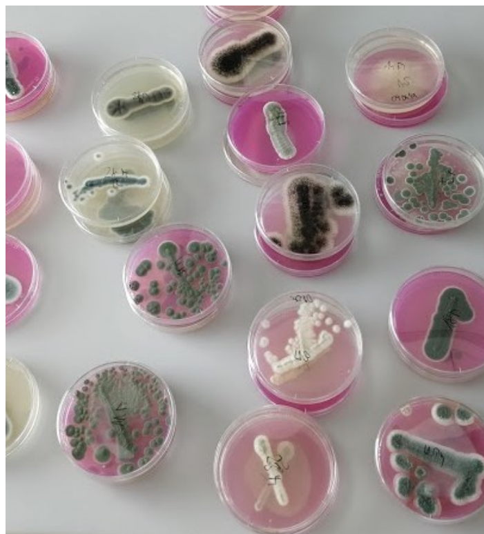
Slika 2. Prikaz izoliranih plijesni poraslih na hranjivim podlogama nakon 7 dana inkubacije