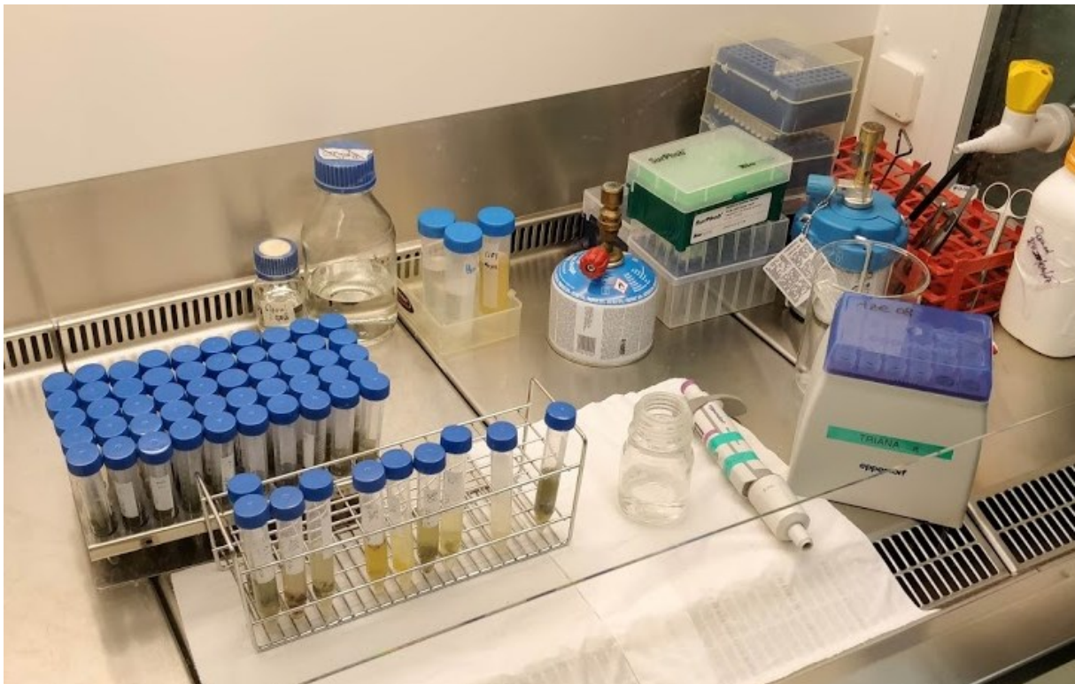
Slika 4. Prikaz ekstrakcije mikotoksina iz čistih kultura plijesni

Ekstrakcija mikotoksina je provedena i modificirana prema Smedsgaard (1997). Izvagano je 1 g kulture plijesni u polipropilensku tubu od 15 mL, dodano 5 mL ekstrakcijskog otapala (acetonitril/voda/octena kiselina, 79:20:1) te je smjesa izmiješana na Vortex miješalici tri puta po 30 sekundi. Uz pomoć Pasteurove pipete i pamučne vate, filtrirano je otprilike 2 mL smjese u plastičnu epruvetu od 2 mL s čepom. Nakon filtracije, 1 mL smjese je kvantitativno prenesen u novu plastičnu epruvetu od 2 mL s čepom gdje se kao takav čuvao na temperaturi hladnjaka do početka HPLC-MS/MS (tekućinska kromatografija visokog učinka-spektrometrija) analize. Dio opisanog postupka je prikazan na slici 4.