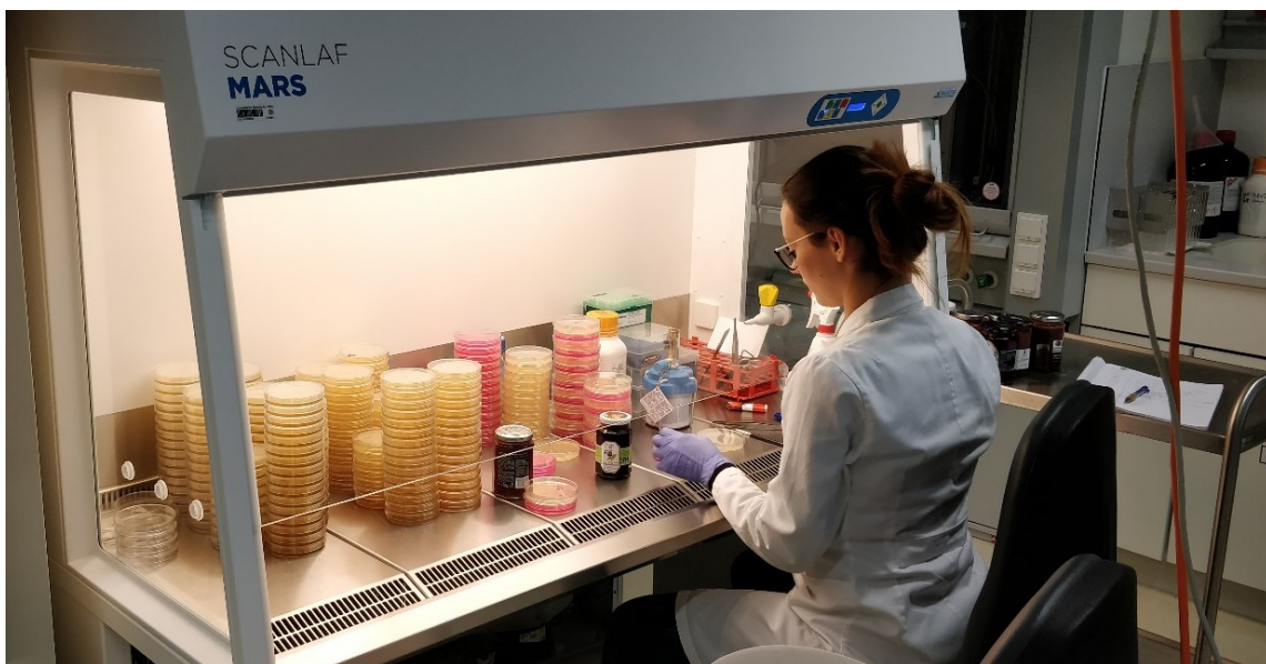
Slika 1. Prikaz postupka izolacije plijesni s površine uzoraka pekmeza

Na slikama 1-3 je prikazan postupak izolacije i identifikacije plijesni poraslih na uzorcima pekmeza.