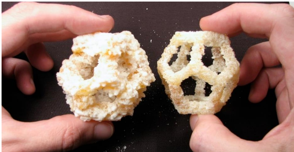
Slika 1. Usporedba strukture s korištenim laserom promjera 5 mm (lijevo) i 1.6 mm (desno). (CandyFab, 2009)

Projekt CandyFab je prvi projekt koji je pomoću šećera uspio napraviti 3D oblike sa vlastitim printerom, CandyFab (Liu i sur., 2017). CandyFab umjesto lasera koristi vrući zrak koji selektivno sinterira i topi šećer u prahu ( engl. SHASAM – selective hot air sintering and melting). Šećer u prahu ima nisku temperaturu taljenja (186 °C), stoga je pogodna sirovina za ovaj postupak. Osim toga, šećer je široko dostupan, jeftin, bezopasan i topljiv u vodi. Za primijenjeni postupak određeno je vrijeme interakcije zračnog pištolja i šećera (1-3 s) te je s većim promjerom lasera osigurana stabilnost strukture. Povećanjem brzine topline lasera, vrijeme trajanja procesa je skraćeno, no konačna struktura je imala lošiju rezoluciju i preciznost (CandyFab, 2009) (Slika 1). (CandyFab, 2009). Smanjenjem promjera lasera s 5 mm na 1.6 mm poboljšala se rezolucija i preciznost ispisa, no došlo je do smanjenja brzine ispisa i mehaničke čvrstoće predmeta (CandyFab, 2009).