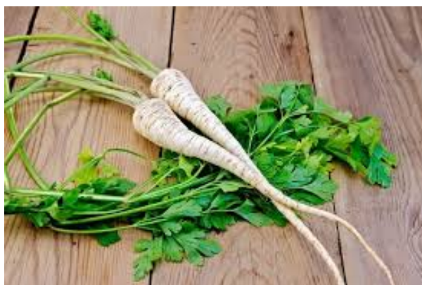
Slika 11. Peršin ( Petroselinum crispum ), (Anonymus 10, 2020)