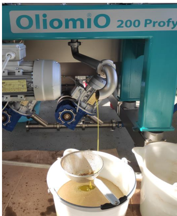
Slika 3 - Mutno ulje nakon prerade

Djevičansko maslinovo ulje praćeno u radu skladištilo se u bačvama od nehrđajućeg čelika u tamnoj prostoriji temperature oko 16 °C. Nakon toga preliveno je u tamne staklene boce. Ukoliko je potrebno ulje se može pretočiti i nekoliko puta kako bi se postigao krajnji cilj, bistro i čisto ulje.