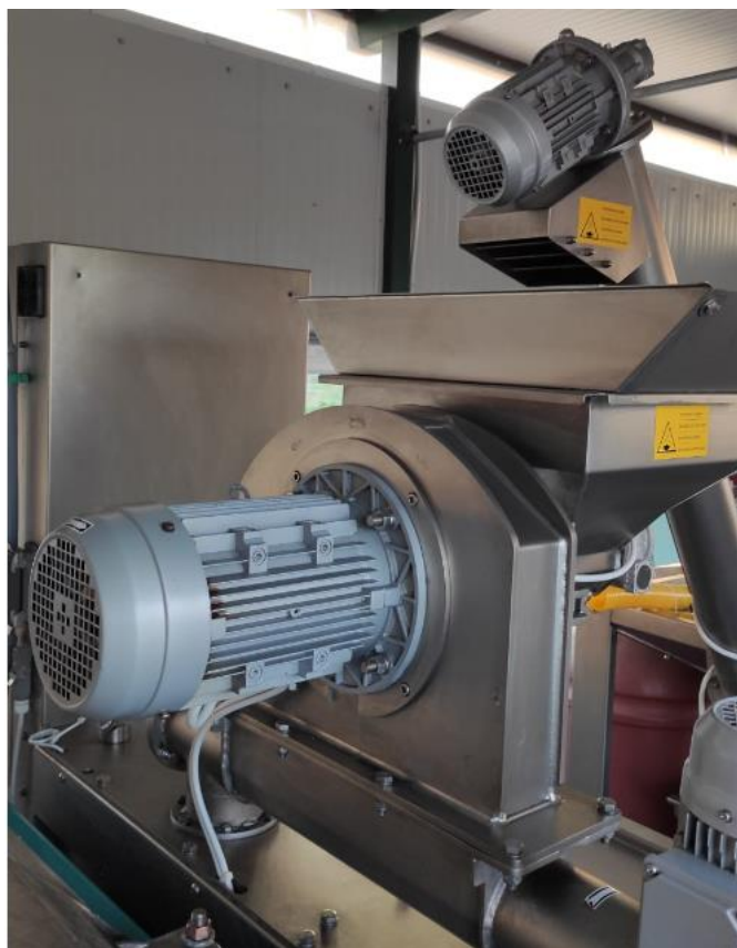
Slika 11 - Dio Olimio profy 200 stroja u kojem se nalazi mlin čekićar

tijekom mljevenja metalnim mlinovima imaju veći stupanj usitnjavanja te se oslobađaju iz vakuola i dolaze u kontakt kapljicama ulja (Gauta, 2018).