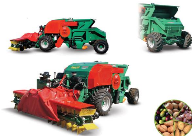
Slika 5 - Stroj za branje maslina (Messis, 2018)

Mehanizirana berba maslina obavlja se visoko sofisticiranim samokretnim strojevima, tresačima. Ovakav način berbe mora biti popraćen određenom logistikom, što podrazumijeva opremljenost adekvatnim mrežama i sinkroniziranom ekipom od 7 radnika. Samohodni tresač je relativno skup i pogodan je za velike maslinike. Omogućuje berbu maslina sa svakog pojedinog stabla u relativno kratkom vremenu i ujedno omogućuje pražnjenje pobranih plodova u prikolicama bez upotrebe ljudskog rada. Samim time smanjuju se troškovi berbe koji ujedno pojeftinjuju samu proizvodnju (Sito i sur., 2013).