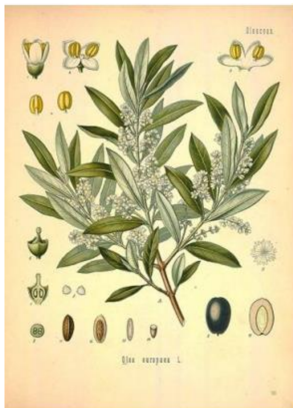
Slika 1 - Morfološki prikaz masline (Oleo Elvira, 2021)