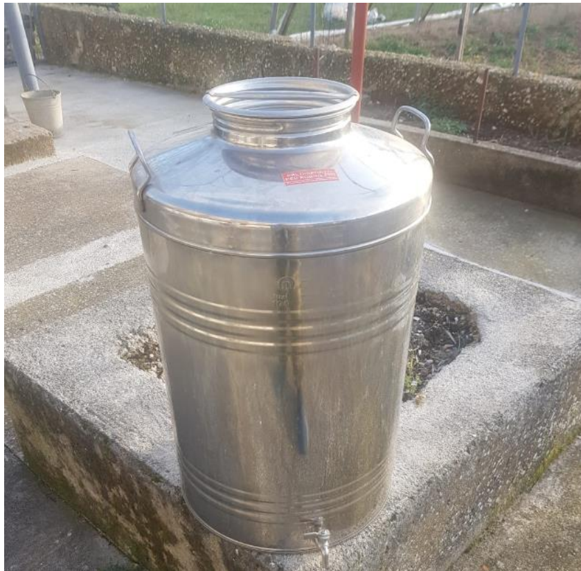
Slika 4 - Inox bačva za čuvanje ulja