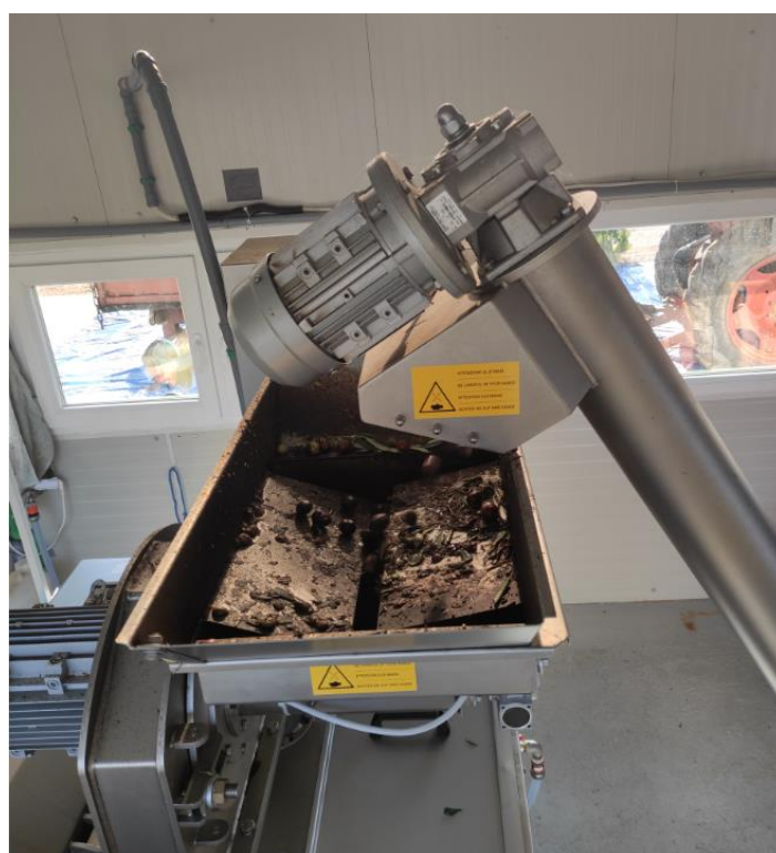
Slika 15 – Transport očišćenih maslina pomoću elevatora u sklopu Oliomio 200 Profy stroja