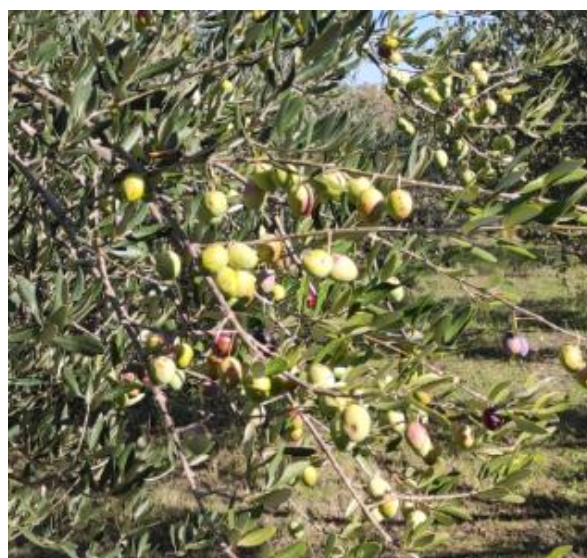
Slika 2 - Sadnica masline Oblica

Oblica se uzgaja na cijelom području Hrvatske te čini oko 60% ukupnog sortimenta maslina. Uzgaja se za proizvodnju ulja i kao stolna sorta. Sa svojim krupnim plodovima doseže količinu ulja od 17 do 22%. Tijekom dozrijevanja mijenja boju od zelene, žućkaste do crvene te na kraju prelazi u crnu. Ima sposobnost regeneracije, u prirodnom uzgoju spontano se pomlađuje kad staro drvo propadne. Dobri oprašivači su joj sorte mastirinka, drobnica, levantinka, lituša i leccino. Dobro podnosi sušu, otporna je na niske temperature i vjetrove. Osjetljiva je na trulež drva i maslinovu muhu, a otpornija na paunovo oko i rak masline. Nedostatak joj je slaba rodnost. Ulje ima miris i okus po zrelom plodu masline, blago je gorko i pikantno s izraženom slatkoćom (Bakarić i sur., 2007).