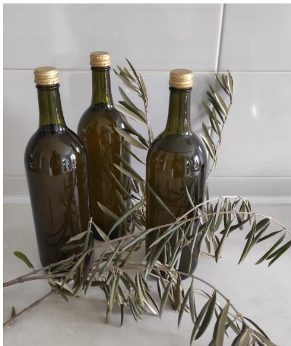
Slika 5 – Čuvanje djevičanskog maslinovog ulja u tamnim bocama