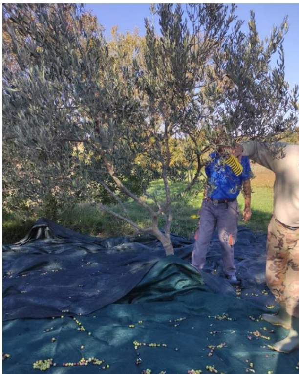
Slika 6 – Tradicionalno ručno branje maslina

U svrhu dobivanja djevičanskog maslinovog ulja koje je praćeno u ovom završnom radu provedena je tradicionalna ručna berba maslina pomoću grabljica i mreže ispod krošnje. Maslinik se nalazi u selu Perušić donji i sastoji se od 30 stabla. Sorta posađene masline je oblica s 3 stabla oprašivača (pendolino). Masline su pobrane početkom 11log mjeseca od strane 3 osobe.