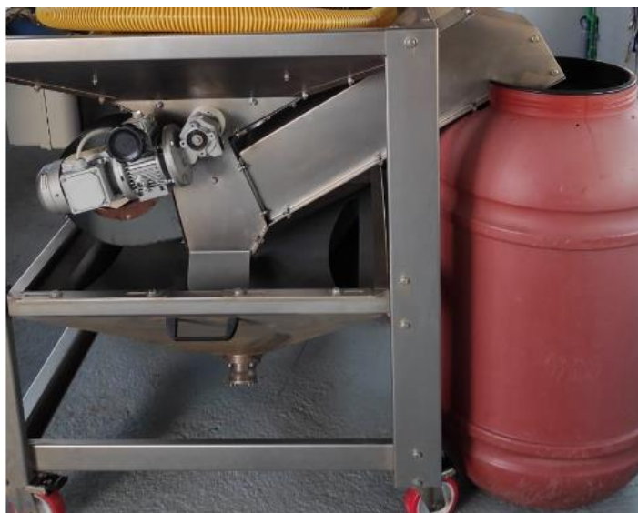
Slika 9 - Dio Olimio Profy 200 stroja za odstranjivanje lišća