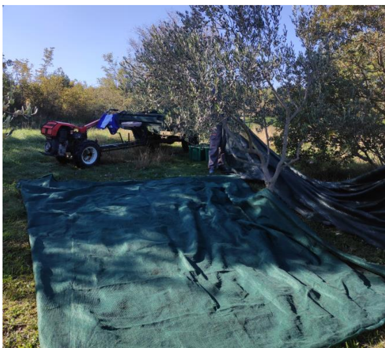
Slika 7 – Postavljena mreža za ručno branje maslina