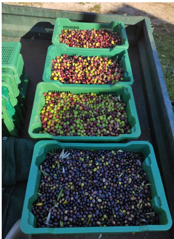
Slika 8 - Čuvanje i transport maslina