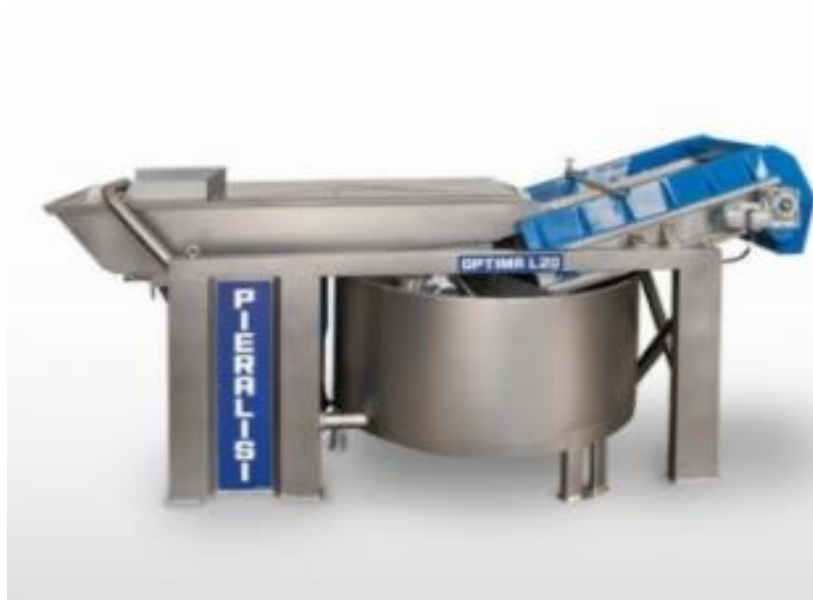
Slika 10 - Stroj za pranje maslina

Pranje maslina je korisno za uklanjanje metalnih ili mineralnih tvari koje mogu biti štetni za mehaničke dijelove mlina i dekantera. Moguća prisutnost pjeskovitog materijala (silicijevog dioksida) s maslinama može uzrokovati abraziju na tijelu dekantera. Voda za pranje pomaže u uklanjanju ostataka proizvoda za zaštitu biljke, ostataka zemlje ili drugih nečistoća koji na taj način mogu ostati na plodu tako da smanjuje rizik od onečišćenja ulja (Aparicio i Harwood, 2013).