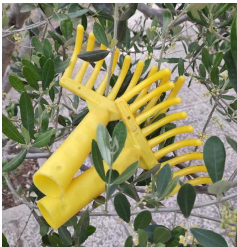
Slika 3 - Grablje za ručno branje maslina

Berba maslina može započeti kad plod dosegne optimalnu zrelost. Optimalna zrelost je najbolji omjer količine i kvalitete ulja koja se može dobiti iz ploda te ovisi i razlikuje se od sorti i do područja uzgoja (Škevin, 2016). Razlikujemo tradicionalnu - ručnu, ručno - mehaniziranu i mehanizirano - strojnu berbu maslina. Prilikom ručne berbe masline se s grana skidaju pomoću grabljica, a padaju na mrežu postavljenu ispod krošnje. Uz plodove otpada i lišće kojeg je potrebno ukloniti. Prednost takvog načina branja maslina je dobivanje svježeg i zdravog ploda s manjom količinom otpadnutog lišća. Međutim ručna berba zahtjeva mnogo radne snage te je skuplja i time povećava cijenu ulja (Sito i sur., 2013).