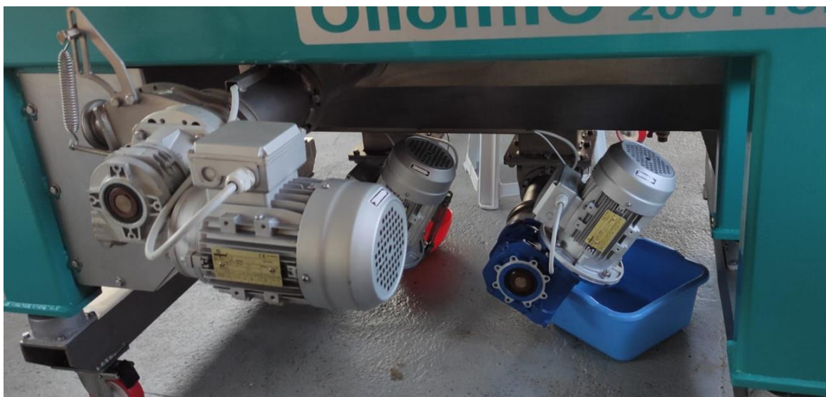
Slika 13 – dio Olimio Profy 200 stroja za centrifugalnu ekstrakciju u 2 faze

Kod opsijskih centrifuga s 2 ili tri izlaza, izdvajanje djevičanskog maslinovog ulja se provodi bez dodatka vode ili uz 10-25% dodatka vode (Škevin, 2016).