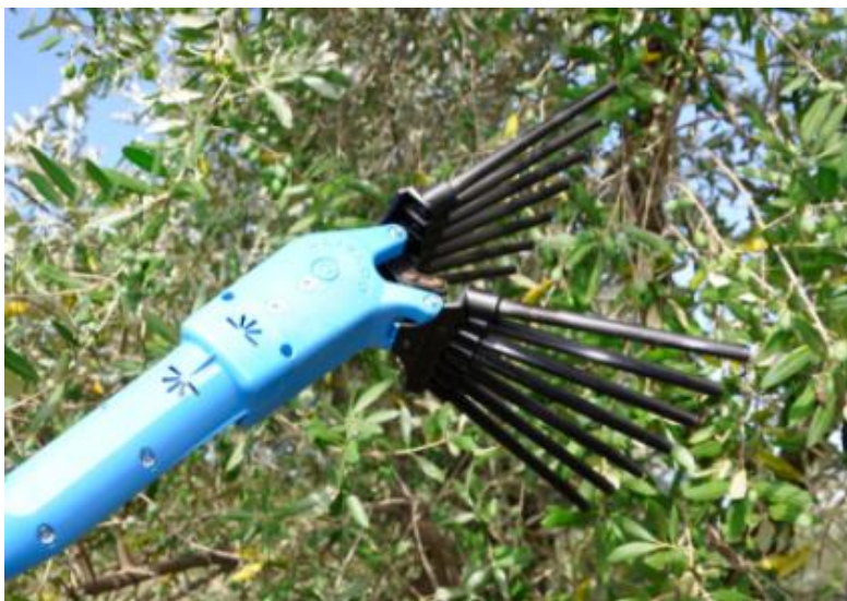
Slika 4 - Ručni tresač za branje maslina (Agraria Banovac, 2021)

pogon od baterije. Rad ovakvim tresačima je jednostavan i puno lakši u odnosu na leđni motorni tresač. Mogu se koristiti pneumatski tresači kod kojih radni dijelovi za protresivanje plodova dobivaju pogon od kompresora (Sito i sur., 2013).