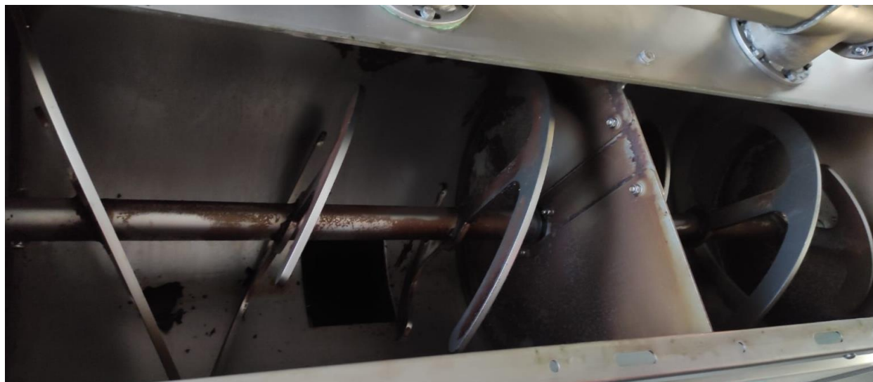
Slika 12. Dvije komore za miješenje tijesta u sklopu Olimio Profy 200 stroja

Djelovanje oksidoreduktaza moguće je potisnuti uklanjanjem kisika pa se uvode mijesilice čiji se hermetički zatvoren prostor može ispuniti dušikom i na taj način osigurati rad u inertnoj atmosferi (Bakarić i sur., 2007).