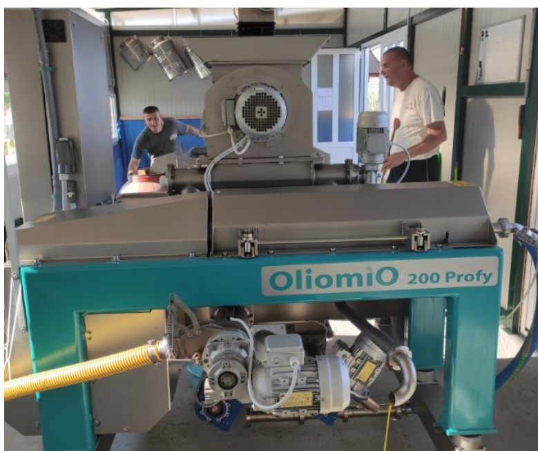
Slika 14 - Oliomio 200 Profy stroj