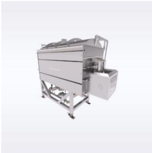
Slika 2. Stroj za kuhanje marke Blentech