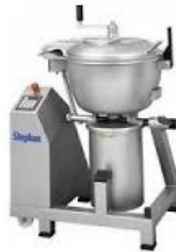
Slika 3. Stroj za kuhanje marke Stephan