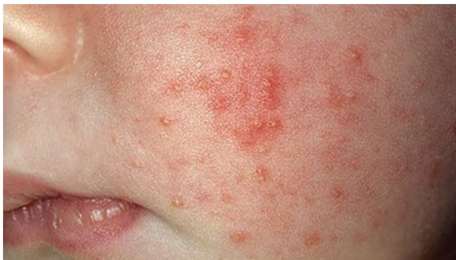
Slika 4. Akne u novorođenčeta (Anonymous 4, 2021)