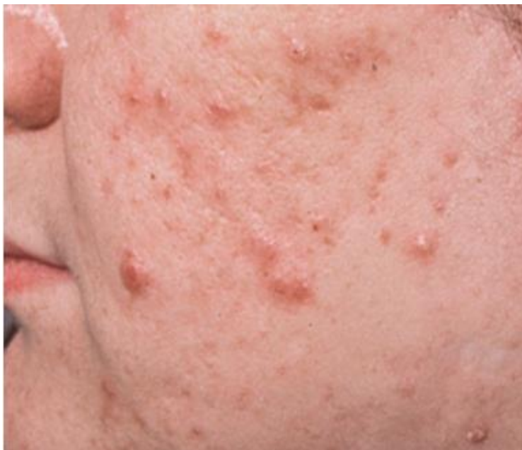
Slika 2. Papulopustularne akne (Anonymous 2, 2021)

Najveći broj pacijenata ima prisutne neinflamatorne i inflamatorne lezije. Inflamatorne lezije mogu biti površinske ili duboke – površinske inflamatorne lezije uključuju papule i pustule (promjera 5 mm ili manje), i one se mogu razviti u duboke inflamatorne lezije – duboke pustule ili nodule kod težih oblika akni.