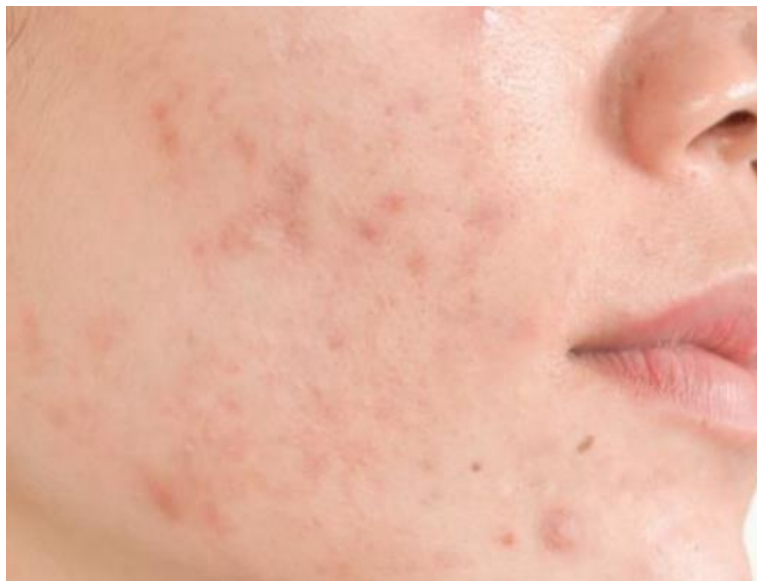
Slika 1. Komedonske akne (Anonymous 1, 2021)