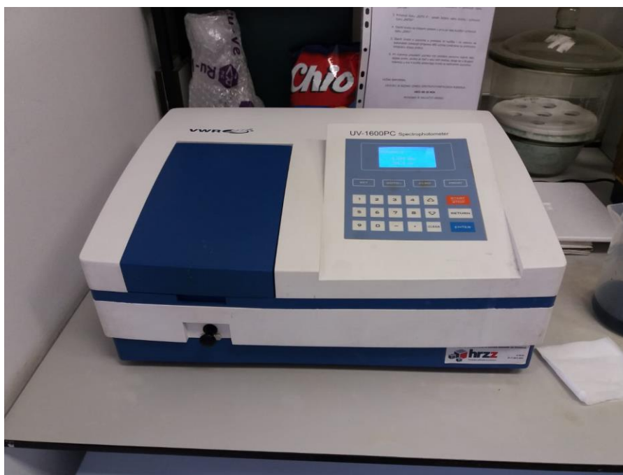
Slika 3. UV/VIS spektrofotometar – VWR UV-1600PC Spectrophotometer

U staklene epruvete otpipetira se 240 \mu L deionizirane vode, 80 \mu L uzorka i 2080 \mu L prethodno pripremljenog FRAP reagensa. Sadržaj u epruveti se dobro pomiješa pomoću Vortex mješalice te se epruvete stave u vodenu kupelj na termostatiranje 5 min na 37 °C. Potom se mjeri apsorbancija na 593 nm (Slika 3). U slijepu probu se umjesto 80 \mu L uzorka dodaje isti volumen ekstrakcijskog otapala: deionizirana voda, 40%-tni, odnosno 96%-tni etanol. Svako mjerenje rađeno je u duplikatu.