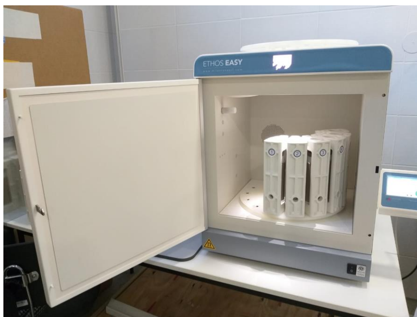
Slika 1. Mikrovalni ekstraktor - Ethos EASY – Advanced Microwave Digestion System

Na analitičkoj vagi izvagan je 1 g ( \pm 0,1 g) usitnjenog lista smokve. Potom je u ekstrakcijsku ćeliju dodano oko 40 mL otapala: deionizirane vode, 40%-tni etanol, odnosno 96%-tni etanol i magnet za miješanje. Ekstrakcijske ćelije se zatvore i stave na pozicije u samom uređaju (slika 1). Mikrovalna ekstrakcija se provodi 10 min na 55 °C. Od 10 minuta, u prvoj minuti je zagrijavanje do 55 °C, a u zadnjoj minuti hlađenje. Snaga mikrovalnog ekstraktora postavljena je na 800 W. Po završetku ekstrakcije, svaki od 9 uzoraka lista i peteljka u tri različita otapala filtrirani su pomoću običnog filter papira i razrijeđeni na volumen od 50 mL u odmjernoj tikvici (slika 2). Do daljnje analize, uzorci su pohranjeni u plastičnu kivetu na hladnom i tamnom mjestu.