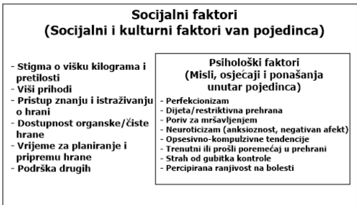
Slika 3. Psihosocijalni model ortoreksije nervoze (preuzeto od McComb i Mills, 2019)

oprezom. Potrebno je razviti pouzdanije metode ispitivanja (korišteni testovi imaju mnogo nedostataka, od loših psihometrijskih svojstava do neprovjeravanja nepravilnosti u funkcioniranju i štete u bitnim segmentima života osobe kojoj se pokušava dijagnosticirati ortoreksija) i uzeti bolji uzorak za ispitivanje (u većini studija su prevladavale ženske ispitanice, tako da su podaci o muškoj populaciji praktički zanemareni) te provesti još puno istraživanja. Za kraj, McComb i Mills (2019) predložili su psihosocijalni model ortoreksije (Slika 3).