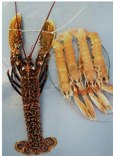
Slika 2. Jedinke hlapa i škampa

Jedinke škampa ( Nephrops norvegicus ) i hlapa ( Homarus gammarus ) nabavljene su na tržnici Dolac u Zagrebu. Neposredno nakon kupnje prebačene su u Laboratorij za opću mikrobiologiju i mikrobiologiju namirnica, Prehrambeno-biotehnološkog fakulteta Sveučilišta u Zagrebu. Nakon ispiranja s destiliranom vodom kako bi se uklonile fizičke nečistoće, u aseptičnim uvjetima uzeti su uzorci probavnog sustava koji su kasnije korišteni za analizu mikrobne populacije.