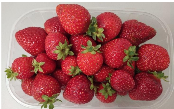
Slika 1. Svježi plodovi jagode sorte 'Albion'

Proces proizvodnje soka od jagode u industriji započinje pranjem jagoda ili odmrzavanjem jagoda ukoliko su skladištene u zamrzivaču. Slijedi pasiranje i depektinizacija voćnog tkiva, prešanje, filtracija, deaeracija te pasterizacija soka (Turk i sur., 2017). Za industrijsku preradu i proizvodnju soka optimalne su sorte jagoda s većim udjelom suhe tvari, jače obojanog i čvrstog mesa, dobre arome, a važno je i lako odvajanje peteljke od ploda (Dubrović, 2012). Rezultati najnovijih istraživanja upućuju na dobar potencijal sorte 'Albion' u proizvodnji voćnih sokova (Bebek Markovinović i sur., 2022) (slika 1).