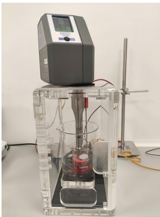
Slika 3. Tretman soka od jagode ultrazvukom visoke snage (UP400St, 400 W, 24 Hz, Hielscher Ultrasonics GmbH, Njemačka)