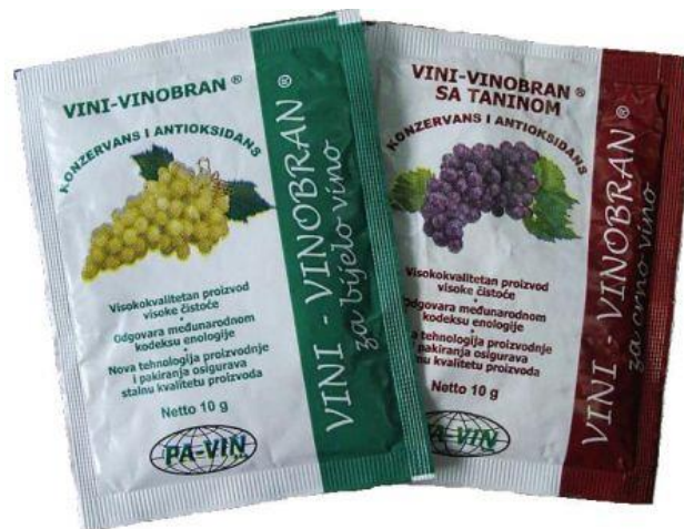
Slika 1. Vinobran (Anonimus, 2022)

Prije upotrebe, vinobran se otopi u vinu ili zakiseljenoj vodi kako bi se kalij vezao na kiselinu, a sumporni dioksid oslobodio (Slika 1, Anonimus, 2022).