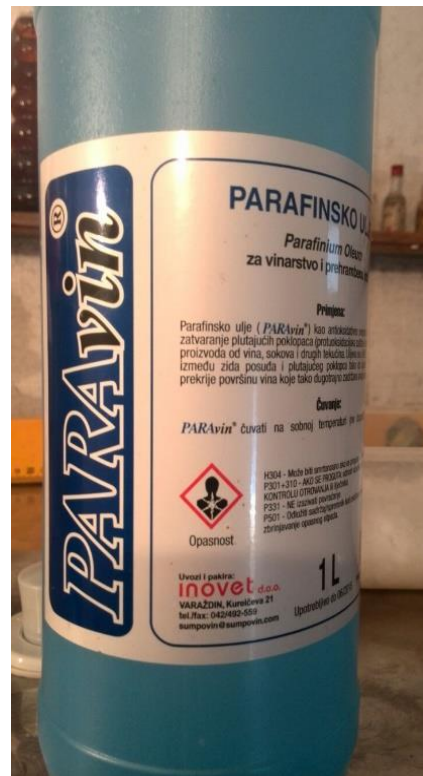
Slika 10. Parafinsko ulje