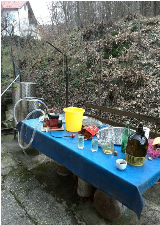
Slika 9. Oprema za pretakanje vina