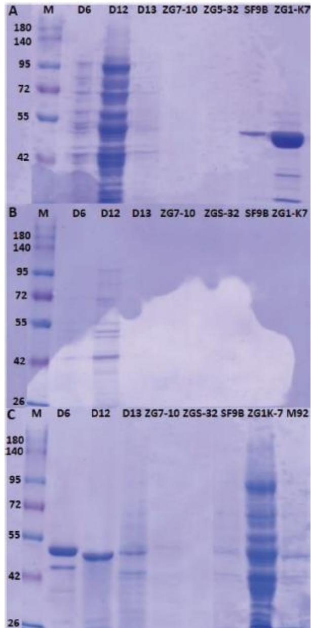
Slika 2. SDS-PAGE potencijalnih proteinaza izoliranih sojeva bakterija mliječne kiseline L. brevis D6, L. fermentum D12, L. plantarum D13, Lc. lactis ZGZA7-10, Lc. lactis ZGBP5-32, L. brevis SF9B i L. brevis ZG1-K7, iz uzoraka A) taloga proteina, B) supernatanta ekstrakta proteina i C) supernatanta ekstrakta proteina nakon ultrafiltracije

Postupak ekstrakcije nije primjenjiv za detekciju proteina iz Lc. lactis budući da proteinske vrpce nisu otkrivene niti u uzorku peleta niti u supernatantu proteinskih ekstrakta (slika 2). Proteinski ekstrakti L. brevis D6, L. fermentum D12 i L. plantarum D13 sadržavali su proteine različitih molekularnih masa izolirane iz peleta ili supernatanta (slika 2A i 2B) pa je potrebna optimizacija protokola s ciljem uklanjanja nečistoća. Kako bi se to moglo postići, proteini su pročišćeni ultrafiltracijskom membranom s graničnom vrijednosti od 100 kDa. Ultrafiltracijom je uklonjen