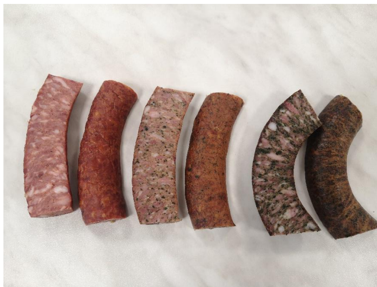
Slika 7. Sušene kuhane kobasice s dodatkom 0 %, 1 % i 3% sušene smeđe morske alge (površina i rez).

Osnovna kemijska analiza (udjel suhe tvari, proteina, masti i soli) kobasica nakon sušenja s različitim udjelom sušene smeđe morske alge (1 % i 3 %), kao i kontrolna skupina kobasica koja nije sadržavala morsku algu je prikazana u tablici 9. Primjenom plinske kromatografije je određen profil izrađenih kobasica te su rezultati prikazani u tablici 10. Boja kobasica s različitim udjelom morske alge je određena kolorimetrijskom analizom i prikazana je u tablici 11. Mikrobiološka analiza je rađena kako bi se utvrdio ukupan broj živih mikroorganizama, ali prisutnost i nekih patogenih (tablica 12).