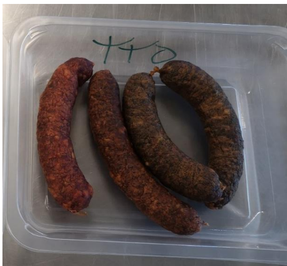
Slika 2. Sušene kuhane kobasice s dodatkom 0 %, 1 % i 3 % smeđe morske alge.