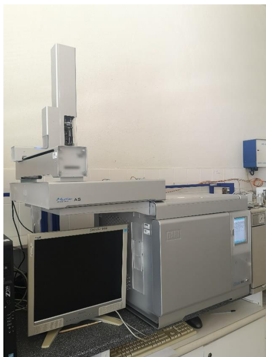
Slika 5. Plinski kromatograf Master fast GC.