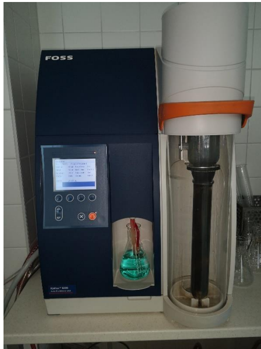
Slika 6. Destilacijska jedinica Kjeltac sustava, Kjeltac 8200.

F- faktor za preračunavanje % dušika u proteine; za meso i mesne proizvode iznosi 6,25