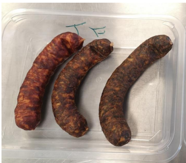
Slika 3. Sušene fermentirane kobasice s dodatkom 0 %, 1 % i 3 % smeđe morske alge.