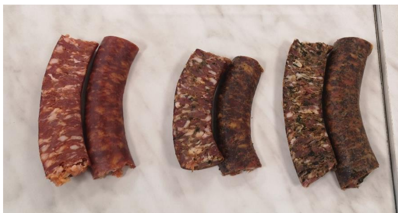
Slika 8. Sušene fermentirane kobasice s dodatkom 0 %, 1 % i 3% sušene smeđe morske alge (površina i rez).