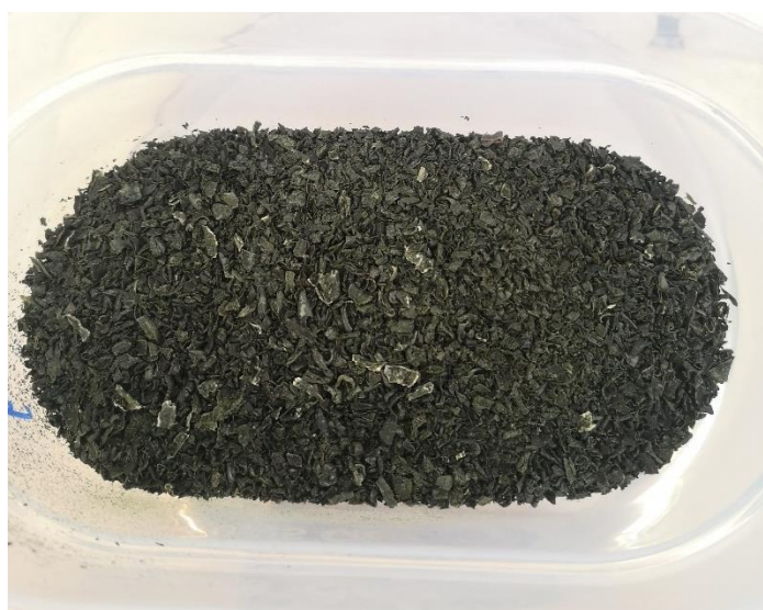
Slika 1. Osušena alga Undaria pinnatifida.

biokemijskih profila kod iste vrste, odnosno promjena u profilu MK (Mena i sur., 2020; Gosch i sur., 2015; Pereira i sur., 2012; Khotimchenko i sur., 2002). Istraživanja su otkrila da je palmitinska kiselina (C16:0) najzastupljenija MK. Profil MK se može razlikovati i ovisno o dijelu alge koji se analizira (npr. na sporofilu, lišću ili središnjoj žilici) (Dellatorre i sur., 2020; Cofrades i sur., 2010). U usporedbi s kopnenim biljkama, morske alge sadrže veći izbor metabolita koji imaju važna biološka svojstva, kao i veće količine visoko nezasićenih masnih kiselina ( \omega -3 EPA i DHA i \omega -6 ARA) koje su važne za ugradnju makronutrijenata u hranidbene mreže. Imaju visoki potencijal ne samo kao izravni prehrambeni proizvod, već i za tehnološke primjene za proizvodnju funkcionalne hrane (Peñalver i sur., 2020; Balboa i sur., 2016).