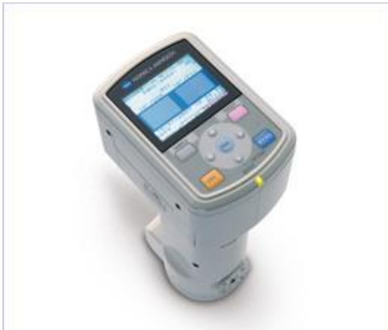
Slika 9. Konica Minolta CM-700d (Fondriest Environmental, Inc. 2022)

Boja je mjerena na površini uzorka buđole, na način da se pokušavalo izbjeći zone s masnim tkivom tako da vrijednosti boje prezentiraju pravu boju mišićnog tkiva buđole. Na slici 9 nalazi se slika spektrofotometra korištenog za određivanje boje.