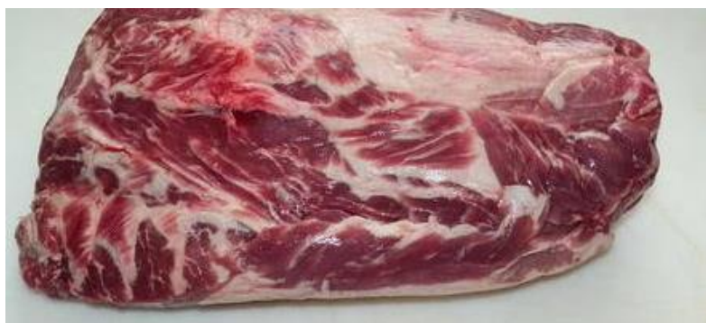
Slika 2. oblikovana svinjska vratina (Moja kuhinja, 2022).

Sama proizvodnja buđole zahtijeva određene komade mesa koji su prošarani masnoćom (slika 2), odnosno komade svinjske vratine. Poželjno je da isti teže 3-4 kg i nadasve da su pravilnog reza. Meso ne smije imati vidljive znakove bilo kakvih traumatskih procesa, mora biti crvenkasto-ružičaste boje i kompaktne strukture. Poželjno meso je od svinje stare između 2 i 3 godine (Kos i sur., 2015).