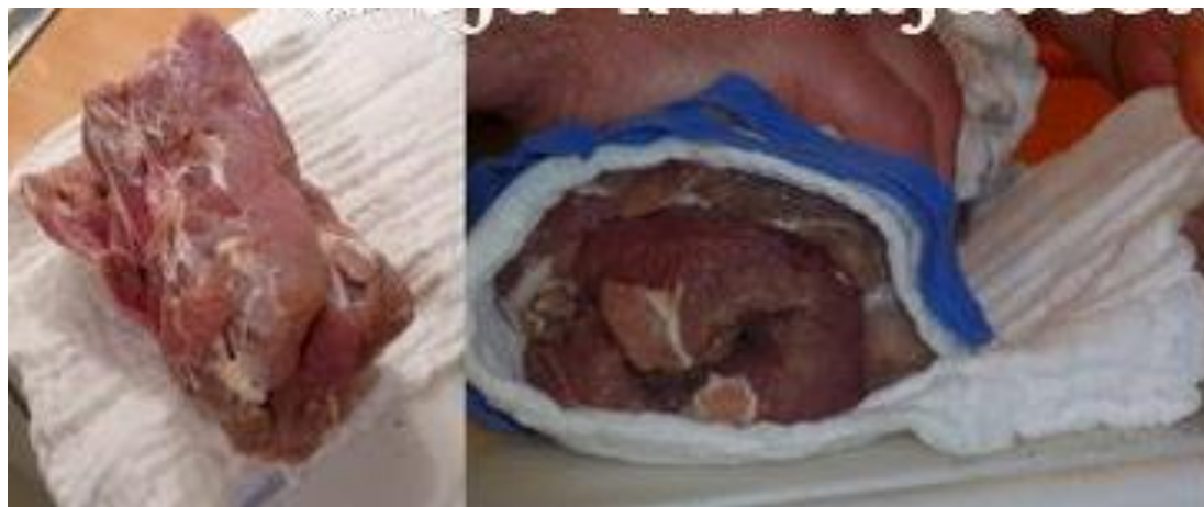
Slika 4. Rolanje buđole (Moja kuhinja, 2022).

Rolana vratina zahtijeva suho meso koje je samo malo ljepljivo, a rolanje vršimo na način da jednom rukom stišćemo meso u rolu, a drugom rukom u suprotnom smjeru vučemo na krpu na kojoj se nalazi. Prilikom rolanja može doći do pucanja ukoliko vučemo meso, jer je ono u rolanju napeto. Na kraju na zarolanu buđolu navlači se mrežica (Slika 4).