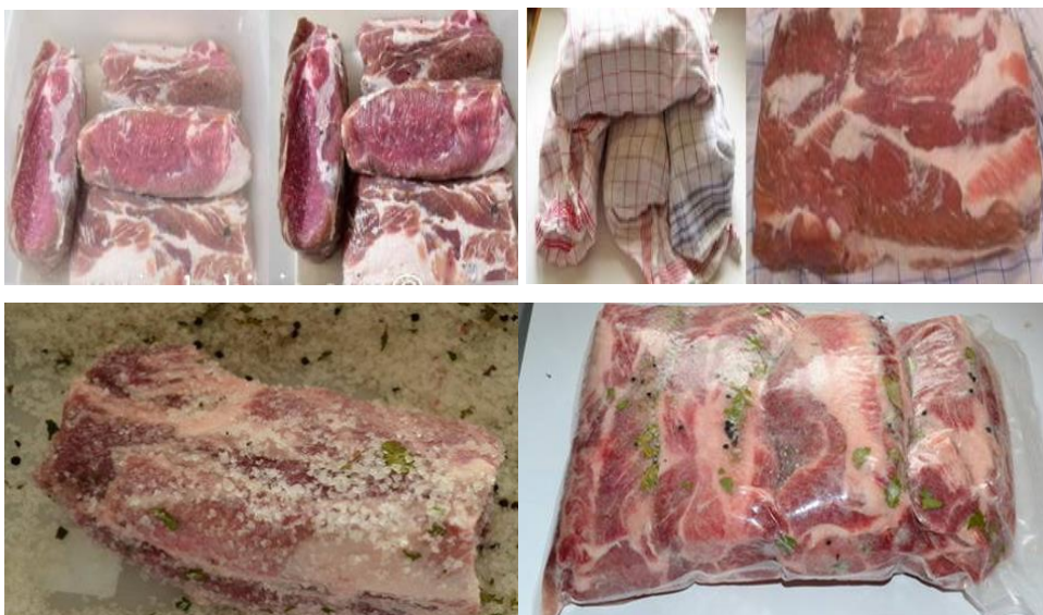
Slika 5. Suho salamurenje i priprema cijelih buđola za sušenje (Moja kuhinja, 2022).

Nakon završetka salamurenja buđole se operu i potom slijedi provjera boje i mirisa te ukoliko udovoljavaju svim kriterijima na 24 sata ih ostavljamo u hladnoj vodi kako bi izišla iz njih suvišna sol. Vodu je potrebno mijenjati tri puta. Ocijeđene i stisnute buđole potrebno je osušiti, te ih ostavljamo zamotane u krpama 24-36 sati u hladnom prostoru.