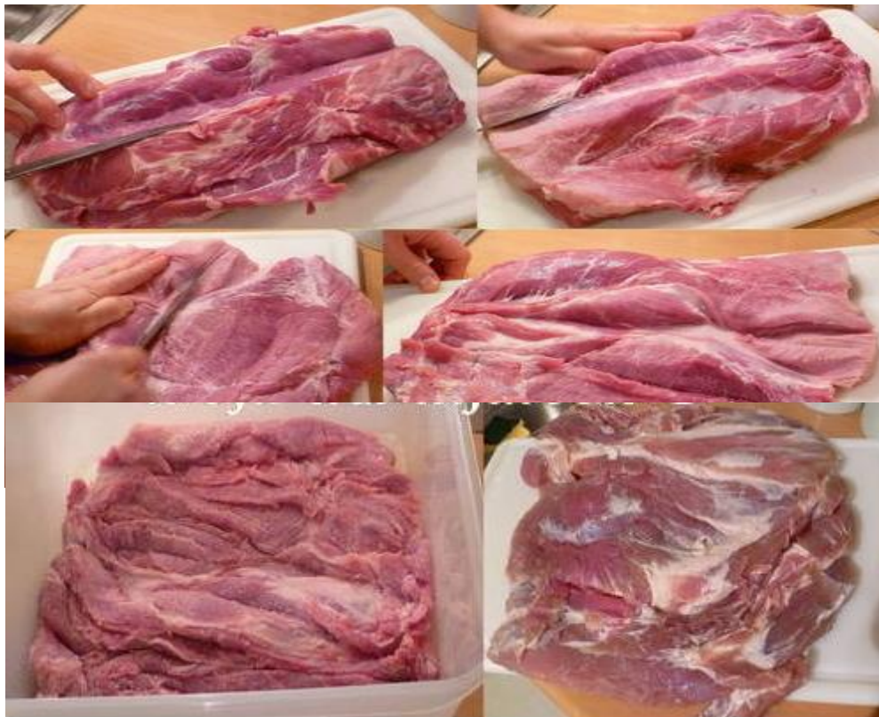
Slika 3. Priprema sirovine za proizvodnju buđole (Moja kuhinja, 2022).

Ukoliko se rolane buđole namaču u začinima ono će trajati duplo kraće u odnosu na one u komadu, a razlog tomu je debljina mesa (slika 3).