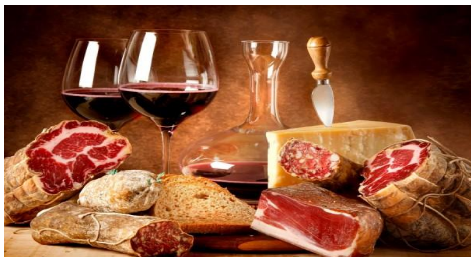
Slika 1. Suhomesnati proizvodi

Postupak soljenja i/ili salamurenja, dimljenje, sušenje, dodatak raznih začina, odnosno sami proces prerade, u konačnici dovodi do kvalitetno obrađenog mesa. Kao posljedicu svih ovih čimbenika imamo određenu aromu, okus, izgled, teksturu, i nadasve kvalitetan proizvod.