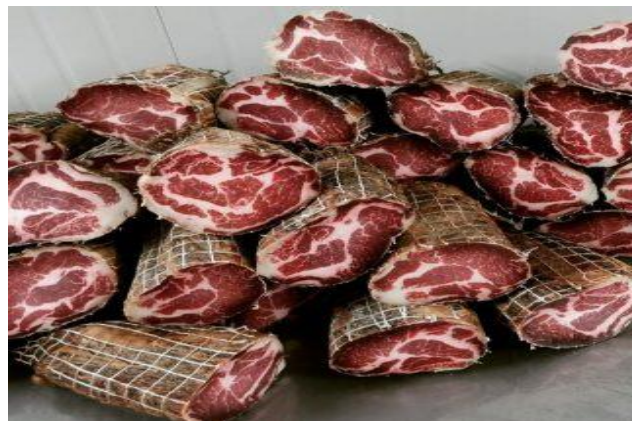
Slika 7. Buđola (Stara Kuća, 2022)

Dimljenje buđola provodi se 14 dana do pet puta u vremenskom periodu po 12 sati. U prvih 48 sati 12 h dimljenja pa 24 h pauze (prva dva dimljenja), dok se treći dim odvija petog dana. Potom se buđole prozrače. Nakon trećeg dimljenja, ako se na površini buđole vidi vlaga, odlučuje se o daljnjem dimljenju. Sušenje buđola je proces koji traje najmanje 75 dana, a najviše 90, a sve ovo ovisi o temperaturi i vlazi u zraku, odnosno 2-10 °C, i 75-85 % vlage. Također sušenje buđola ovisi i o njihovoj veličini, osušenim smatramo onu buđolu koja je tvrda na dodir. Nakon 90 dana sušenja vakuum pakirane buđole se ostavljaju još šest mjeseci na hladnom mjestu. Iz razloga što sam postupak dimljenja nema dovoljan konzervirajući učinak kombinira se sa drugim metoda, uglavnom soljenjem i sušenjem (Vuković, 2012). Izgled presjeka gotovog proizvoda prikazan je na slici 7.