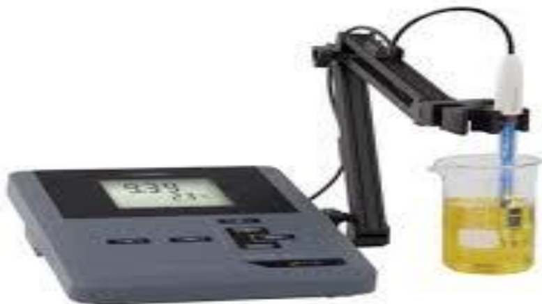
Slika 8. Uređaj za mjerenje pH (benchtop sensION tm MM374, Hach Company, Loveland, CO, US) (Fondriest Environmental, Inc. 2022)

pH uzorak je mjereno u triplicatu korištenjem digitalnog pH metra (benchtop sensION tm + MM374, Hach Company, Loveland, CO, USA). Na slici 8 se nalazi prikaz izgleda pH metra korištenog za mjerenje pH uzorka buđole.