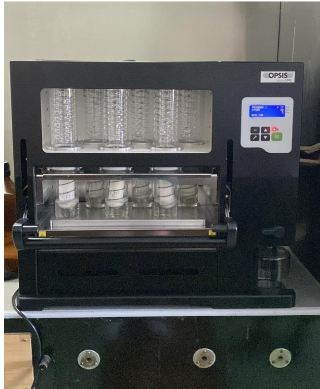
Slika 5. SOXROC aparatura za ekstrakciju ulja