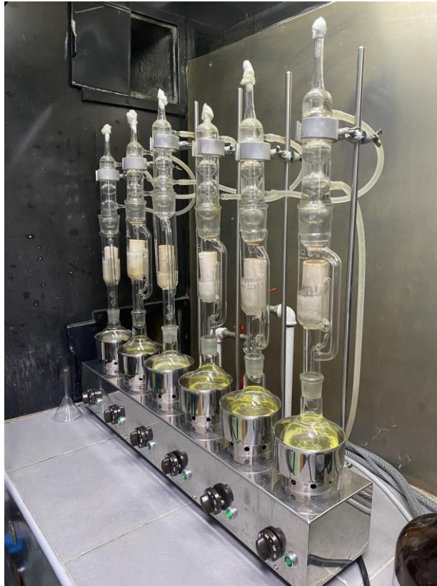
Slika 4. Soxhlet aparatura za ekstrakciju ulja

je provedeno u električnom mlincu tako da uzorak bude ravnomjerno samljeven. Na dnu čahure stavljena je vata, dodano je samljeveno sjeme te je tako napunjena čahura zatvorena vatom i stavljena u aparaturu po Soxhletu (slika 4). Dodan je potreban volumen petroletera koji je korišten kao otapalo, a ekstrakt se skupljao u izvaganu tikvicu u koju su prethodno stavljene 2 staklene kuglice za vrenje.