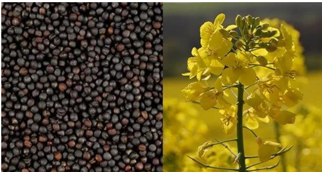
Slika 3. Prikaz sjemena, stabljike i cvjetova uljane repice (Medved, 2023)

Stabljika repice je zeljasta i razgranata dok visina grananja i broj postranih grana ovisi o sorti, gustoći sklopa te ekološkim uvjetima. Ovisno o hibridu ili sorti, može narasti u visinu od 1,5 do 1,8 m. Listovi su različitog oblika, plavkasto-zelene boje, glatki ili s rijetkim uspravnim dlačicama. Cvjetovi uljane repice su dvospolni, a se sastoje od 4 lapa, 4 latice te 6 prašnika i tučaka (slika 3). Latice su intenzivno žute boje. Ovisno o sorti i ekološkim uvjetima, broj cvjetova na biljci po biljci može dosegnuti i do 4000 (Pospišil, 2013).