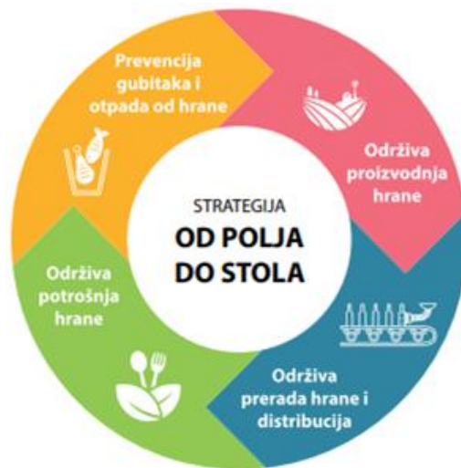
Slika 3. Od polja do stola (Ministarstvo poljoprivrede, 2021)