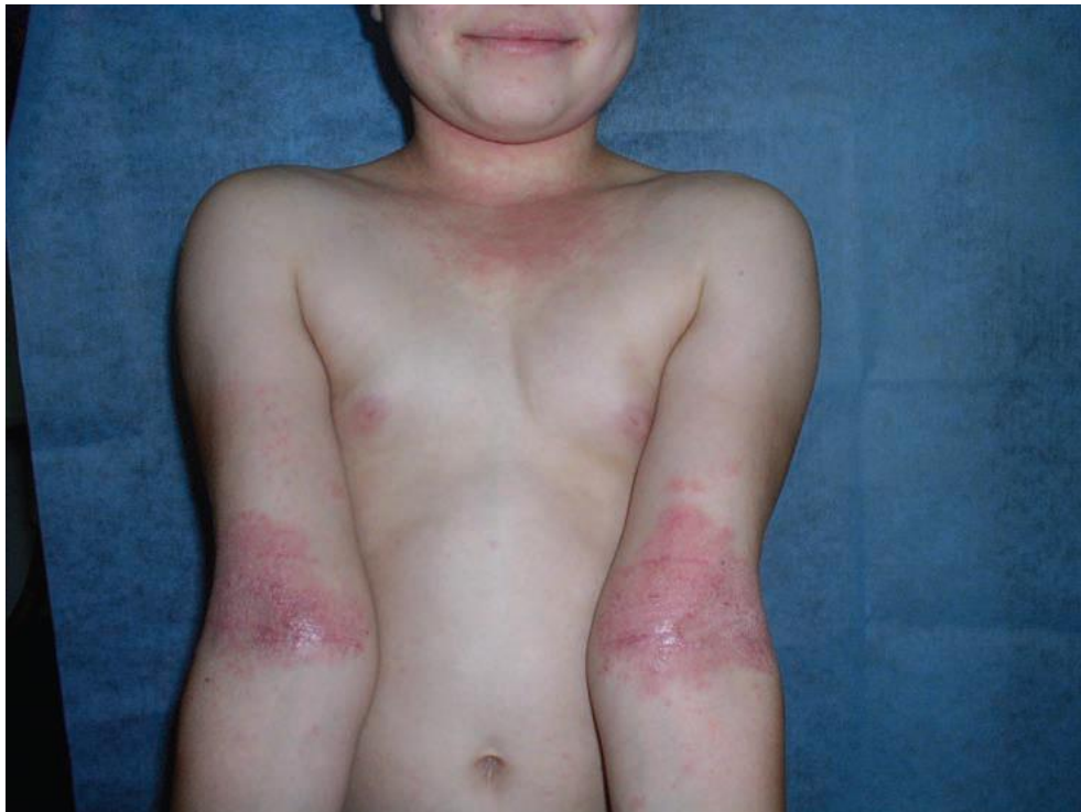
Slika 1. Karakteristična distribucija simptoma kod starijeg djeteta na vratu, dekolteu te pregibima laktova (Murat-Sušić, 2007)