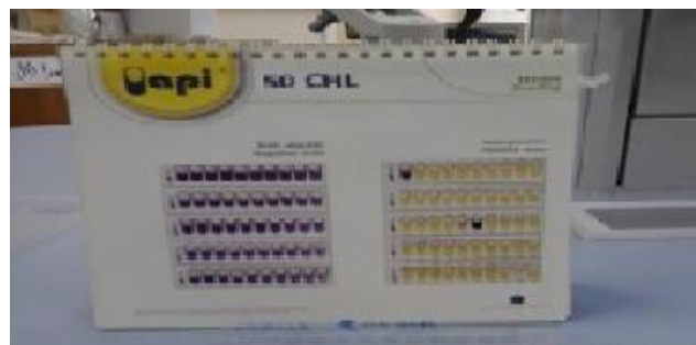
Slika 2. Predložak za API 50 CHL test

Ispitivana bakterijska kultura uzgojena je na MRS i M17 agaru u obliku kolonija anaerobno i aerobno kroz 24 sata pri 37°C. U ampulu, koja sadrži API 50 CHL medij za laktobacile, je pomoću sterilne mikrobiološke ušice dodano nekoliko identičnih kolonija MRS i M17 agara. Gustoća inokuluma, koja se mjeri u denzitometru je standardizirana prema 2 McFarland. Pripremljena suspenzija nakapana je u cjevčice API 50 CHL stripa koji sadrži 49 različitih ugljikohidrata pazeći da se ne formiraju mjehurići. U sve cjevčice nakapano je mineralno ulje kako bi se osigurali anaerobni uvjeti. Inkubacija je trajala 48 h pri 37°C nakon čega je provedeno očitavanje rezultata na temelju boje reakcije. Pozitivnim se smatraju testovi kod kojih je uslijed acidifikacije i prisutnosti bromkrezol purpurnog indikatora došlo do promjene boje u žuto. Biokemijski profil je identificiran pomoću softvera s bazom podataka.