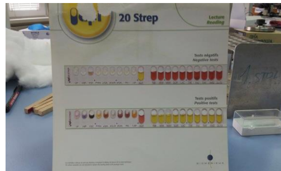
Slika 3. Predložak za API 20 Strep test