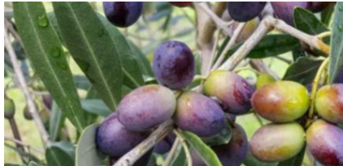
Slika 3. Istarska bjelica (Trojanović d.o.o., 2024)

stabilnosti. Relativno je otporna na niske temperature te na bolesti i štetočine, međutim, osjetljiva je na maslininu muhu (Modrušan, 2022).