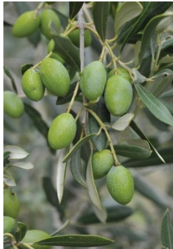
Slika 5. Levantinka (Maslinar, 2023)

Levantinka (slika 5) je autohtona hrvatska sorta s područja Srednje Dalmacije, a rasprostranjena je i po Južnoj Dalmaciji. Sinonim joj je šoltanka jer se najveća populacija nalazi na otoku Šolti. Ima stablo visokog i glatkog debla s okruglastom širokom krošnjom. Listovi su veliki, eliptični, s tamnozelenim licem te svijetlozelenim naličjem. Ima visoku samooplodnju (do 77 %), a dobar je oprašivač za oblicu, buharicu i drobnicu. Plodovi su srednje veličine, eliptični i duguljasti. Tijekom dozrijevanja boja prelazi iz zelene do crveno ljubičaste pa do crne. Prosječna težina ploda je 4 g, količina ulja oko 20 %. Sorta je osjetljiva na sušu i niske temperature, ali otporna na jake vjetrove. Ima veliku osjetljivost na paunovo oko i trulež plodova te srednju otpornost na rak masline, maslininu muhu i moljca (Modrušan, 2022).