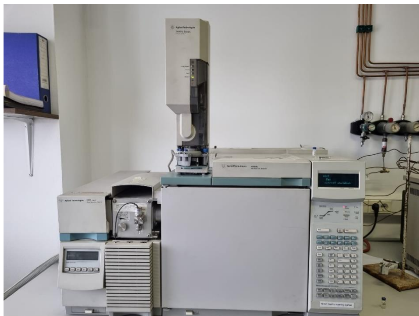
Slika 7. Plinski kromatograf Agilent Technologies 6890N Network

Masne kiseline identificiraju se usporedbom retencijskih vremena njihovih metilnih estera s retencijskim vremenima metilnih estera iz komercijalnog standarda poznatog sastava (F.A.M.E. C8 – C22, Supelco).