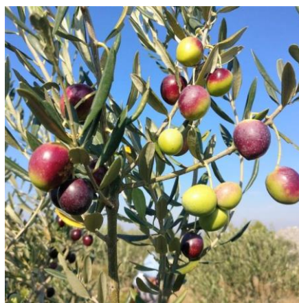
Slika 4. Oblica (Modrave Murter-Betina, 2021)

Oblica (slika 4) je autohtona sorta Srednje Dalmacije koja je rasprostranjena po cijelom uzgojnom području masline u Hrvatskoj. Ima puno sinonima, a neki su: balunjača, debela maslina, domaća, jadranka, krupnica, lušinjka i maslina obična. Ima stablo s gustom i okruglom krošnjom, a listovi su široki, dugi i jajoliki. Dobri oprašivači su ascolana tenera i picholine od stranih sorti te drobnica, levantinka i lastovka od domaćih sorti. Plodovi su okrugli i krupni (najčešće 5 do 10 g) (Modrušan, 2022). Prosječni udio ulja sorte oblica iznosi 17 - 22 % (Škevin, 2016). Zbog toga je pogodna za proizvodnju ulja, a zbog veličine plodova te čvrste konzistencije mesa pogodna je i za konzerviranje. Boja plodova se kreće od svjetlo zelene do crne, a zbog neujednačenog dozrijevanja na stablu se mogu naći plodovi različite obojenosti. Otporna je na nepovoljne uvjete, kao što su suša i niske temperature. Ima dobru otpornost na paunovo oko i rak masline te srednju otpornost na maslininog moljca i muhu (Modrušan, 2022).