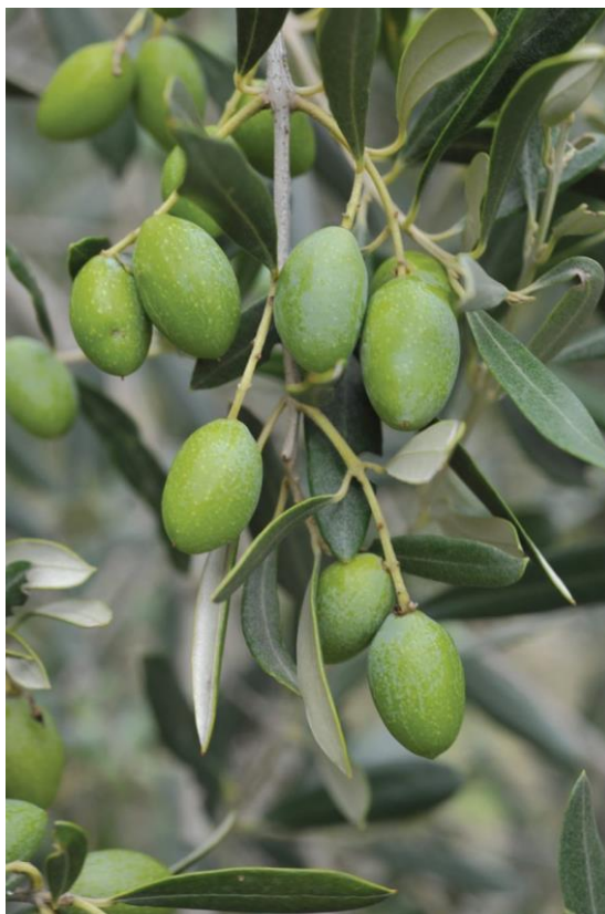
Slika 1. Levantinka (Maslinar, 2020)

duguljastog oblika, blago uvijeni prema vrhu s malim oštrim vrhom. Tvrda kožica u fazi pune zrelosti je crne boje, dužine oko 2,2 cm, širok oko 1,3 cm, težine oko 4,3 grama, dok je randman ulja u plodu u optimalnoj fazi zrenja (berba sredinom listopada) oko 13,5 posto (Maslinar, 2014). Osjetljiva je na sušu i na hladnoću, srednje je otporna na napad maslinove muhe i raka, ali je jako osjetljiva na paunovo oko (Maslinar, 2020).