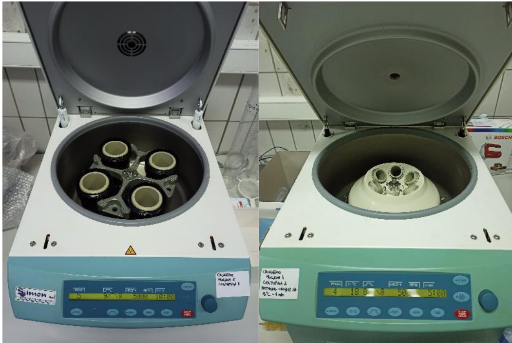
Slika 3. Centrifuga, Hettich Rotina 380 (lijevo) i Centrifuga, Hettich Rotina 380R (desno)