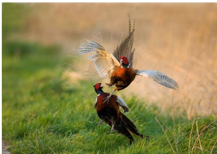
Slika 2. Fazanska divljač iz prirodnog uzgoja u nizinskom lovištu (Anonymous 3, 2015)

Danas više da i nema idealnih staništa za fazane jer su pod utjecajem urbanizacije i suvremene tehnologije koja se primjenjuje u poljoprivredi. Kod uzgoja fazana na kontinentu teškoće predstavljaju sve veće površine zasijane monokulturama, izostanak tradicionalne poljoprivrede, kemizacija u poljoprivredi, hladna razdoblja s dugotrajnim padalinama i urbanizacija (Lovrić, 2004). Kako bi se postigli dobri rezultati pri prirodnom uzgoju potrebno je neprestano poboljšavati stanišne prilike.