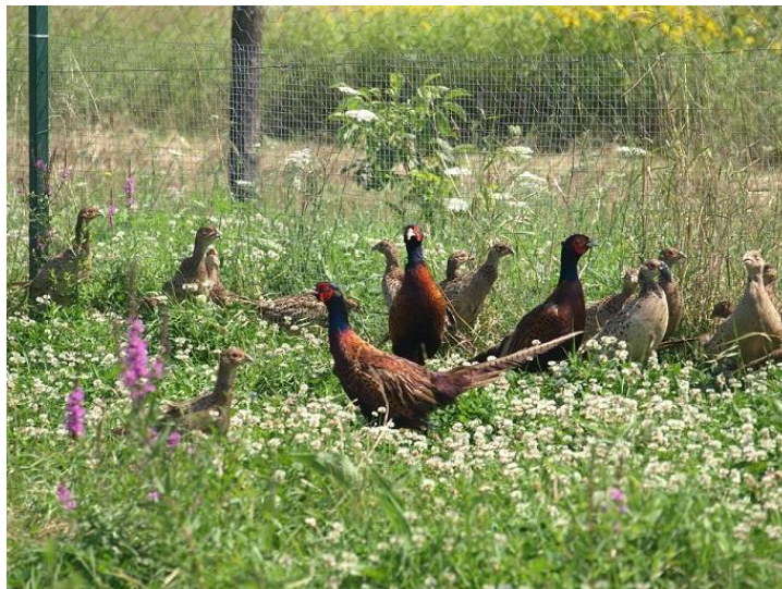
Slika 3. Fazani iz kontroliranog uzgoja (Anonymous 5, 2015)

Kontrolirani uzgoj divljači zahtjeva velike investicije jer su sami uređaji vrlo skupi (volijere, inkubatori, valionici itd.), te stručno osoblje. I dalje se ovaj način uzgoja najuspješnije primjenjuje kod fazana (Darabuš, 2004c).