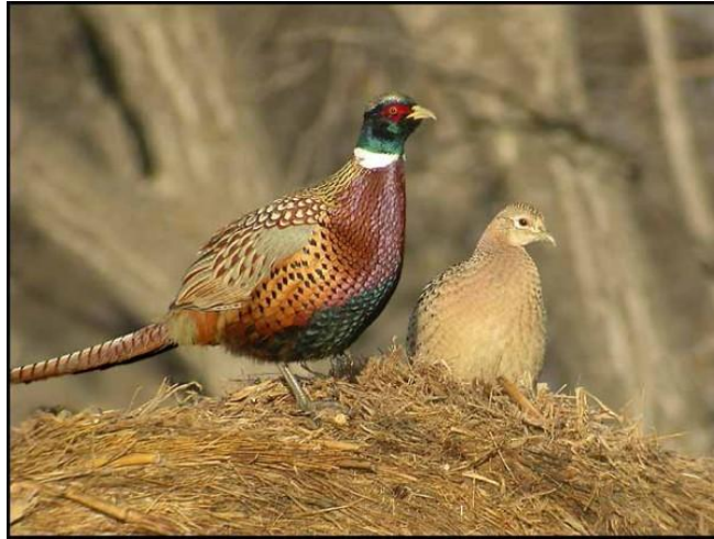
Slika 1. Mužjak (lijevo) i ženka (desno) fazana (Anonymous 4, 2015)

Mužjak je obojan u prekrasne, jarke boje dok je ženka smeđe-siva radi boljeg stapanja s okolišem (zaštitni karakter). Boja mužjakovog perja znatno varira zbog križanja raznih podvrsta. Prepoznatljiv je po jarkocrvenom obojenju kože oko očiju i ima ostrugu, tj. peti prst koji izraste na stražnjoj strani nogu koja služi za determinaciju starosti (Anonymous 3, 2015).